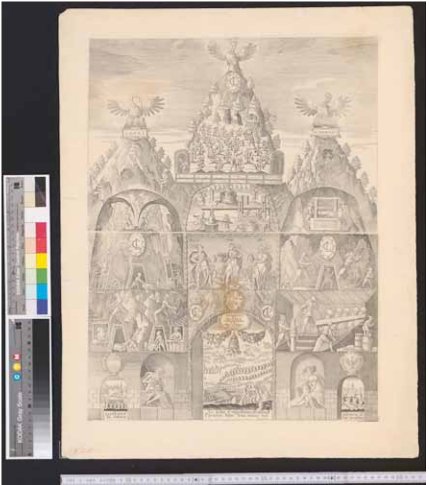
Abb. 2: Tirol als Bergmassiv: Ehrenpforte zur Hochzeit von Claudia de' Medici mit Erzherzog Leopold V. im Jahr 1626. Stich von Andreas Spängler, TLMF, FB 6500

muri . 35 Im weiteren Verlauf der Szene werden Tirols Felsen, Berge und Hügel noch mehrmals angesprochen, in der folgenden (II 3) 36 , freuen sich Berge und Bergbewohner ( monticolae ) über die Ankunft von Pax. In Szene III 3 schwebt ein Tiroler Adler über Tiroler Berge – das Wappentier wird also in seinem natürlichen Lebensraum vorgestellt –, und der Hochzeitsgott musiziert auf einem Berg. Schließlich apostrophiert die Perioche zu III 6 die Tiroler wieder als monticolae . Die starke Betonung der alpinen Kulisse ist hier offenbar der Vorstellung vom Gebirge als Schutzwehr gegen äußere Feinde geschuldet.