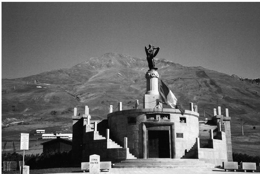
Ossario per i caduti della Prima guerra mondiale, Passo del Tonale, realizzato nel 1924 (Josef Steinacher)