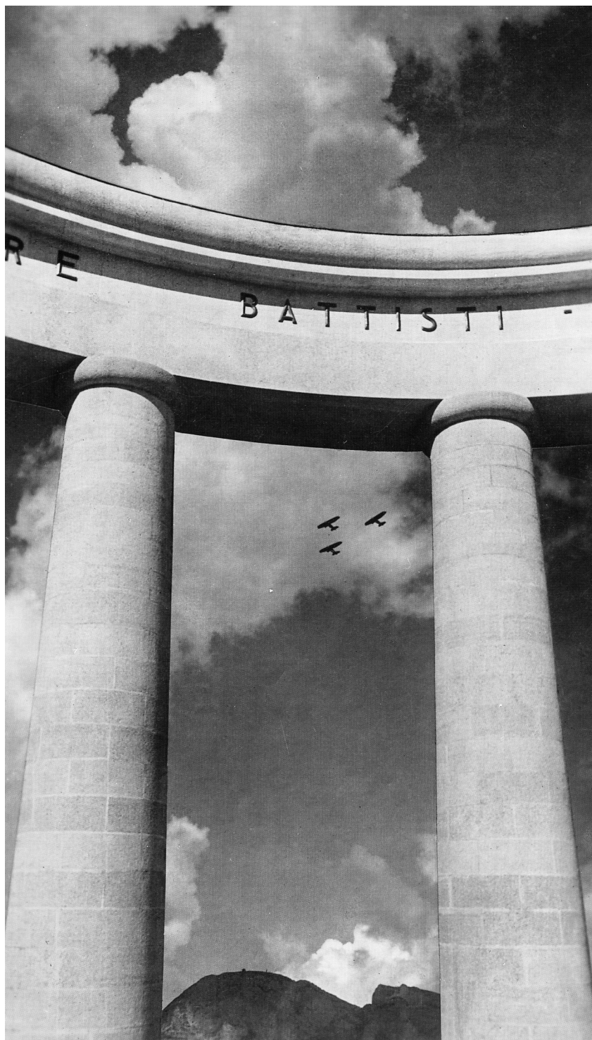
Mausoleo di Cesare Battisti, Trento, particolare (Museo storico in Trento, Foto Pedrotti)