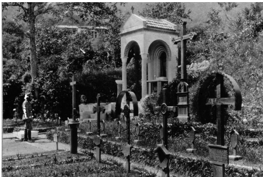
Cimitero militare austro-ungarico, Campi, 1917 circa