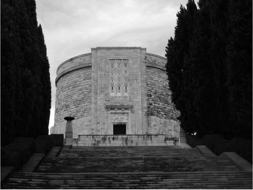
Ossario a Oslania (57.200 morti), in prossimità del confine sloveno, non lontano da Gorizia, completato nel 1938 (Josef Steinacher)

e di tacito e commosso raccoglimento” 28 . La soluzione adottata elimina il ricorso alla scultura. Sono i volumi architettonici, resi solenni attraverso un calcolato ritmo ascensionale e circolare, che diventano scultorei, si fanno monumento. A questo impianto Libera torna in occasione del concorso per il palazzo del Littorio a Roma (1934). Qui l’atmosfera è ancora più rarefatta e trascendentale: la grande croce è al centro di un disco sospeso che ripete senza sosta la magica parola. Nello stesso concorso romano, Giuseppe Samonà propone per il sacrario una configurazione simile, con un monolite centrale, statico, avvolto da un corpo curvo.