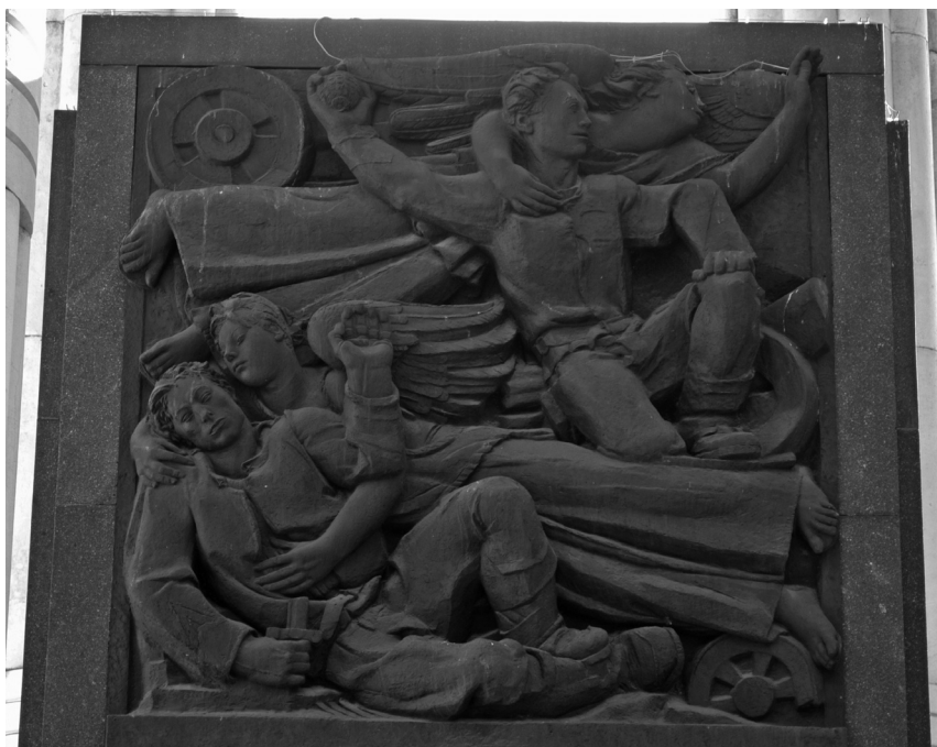
Rilievo in bronzo nel Monumento alla Vittoria, Bolzano: angeli che accompagnano i caduti dal campo di battaglia in cielo

unitaria tra la costruzione e la forma, tra il mezzo e l'espressione." 27 La formula suggerita da Plinio Marconi nel 1933 vale particolarmente per gli interventi monumentali. Nel corso degli anni Trenta le indicazioni più significative vengono dal lavoro progettuale per il sacrario fascista, dalle realizzazioni degli ossari nazionali, un campo nel quale emerge l'opera congiunta di Greppi e Castiglioni, e da alcuni concorsi che vedono impegnati anche gli architetti razionalisti.