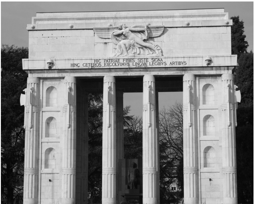
Das Siegesdenkmal, immer noch ein schwieriges Erbe für Bozen (Südtiroler Landesarchiv)