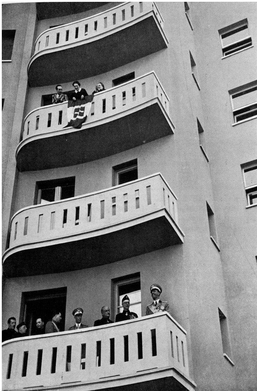
Der Herzog von Savoia in Bozen bei der feierlichen Eröffnung einer Wohnsiedlung der INCIS (L'Attività dell'Istituto Nazionale per le Case degli Impiegati dello Stato, Rom 1940)

des römischen Imperiums anknüpfen. Einheitlich und durchgehend sind auch die etwa fünf Meter hohen Bogengänge, ebenfalls geprägt von der für Piacentinis „Scuola romana“ typischen neoklassizistischen Monumentalarchitektur. Dabei