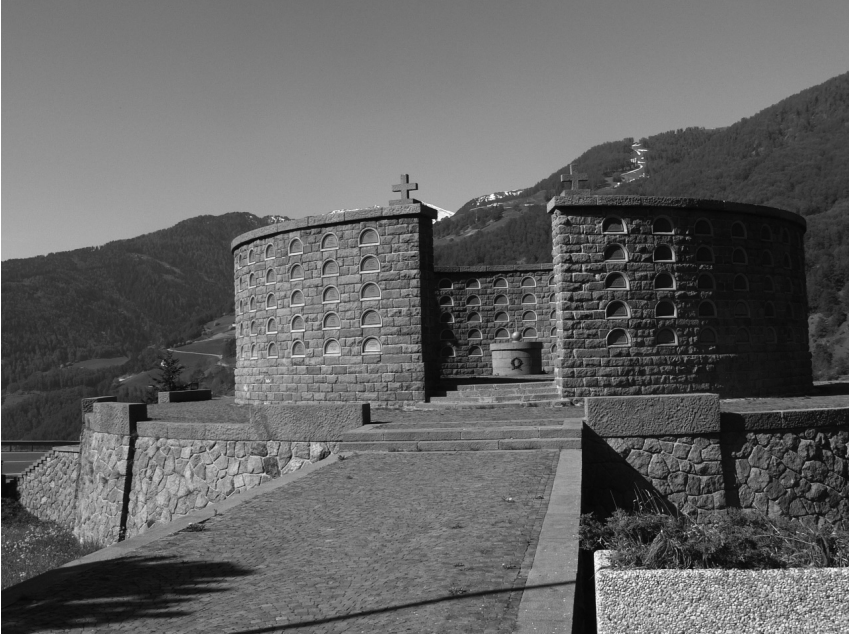
Das Beinhaus (Ossarium) in Burgeis am Reschenpass

Eines der prominentesten Denkmalprojekte befindet sich mitten auf der Hochfläche der Sieben Gemeinden (Sette Comuni). Dort erhebt sich im Ortsteil Leiten das Heldendenkmal von Asiago, das Schauplatz schwerer Kämpfe gewesen war. Der Bogen, in leuchtend hellem Marmor gearbeitet, auf einer kleinen Anhöhe mitten in den satten grünen Wäldern und Wiesen, macht einen imposanten Eindruck. Die Krypta besteht aus Grabkammern für 12.795 gefallene italienische Soldaten des Ersten Weltkriegs. In der Kapelle hingegen befindet sich die Gruft für 21.491 unbekannte italienische Soldaten. Innerhalb des Ossariums ruhen auch 20.000 Gefallene der österreichisch-ungarischen Armee. Anfangs zeigten die Kriegerdenkmäler nämlich durchaus noch versöhnlichen Charakter; die Feinde von einst teilten oft gemeinsam eine würdige Ruhestätte. 56 Diese Politik der vorsichtigen Versöhnung wurde 1926 durch die Entscheidung Mussolinis radikal beendet, in Bozen das Siegesdenkmal mit seinem offensiven Charakter errichten zu lassen. Nun wurden die Toten vom Regime offen instrumentalisiert, unter ihnen auch der Trentiner Sozialist Cesare Battisti. Das Mausoleum für Battisti auf dem Doss Trento am Stadtrand von Trient wurde noch vom italienischen Parlament kurz nach seiner Hinrichtung durch die Österreicher 1916 gefordert, 1926 beschlossen und 1935 vom Architekten Ettore Fagioli fertig gestellt. 57 Die