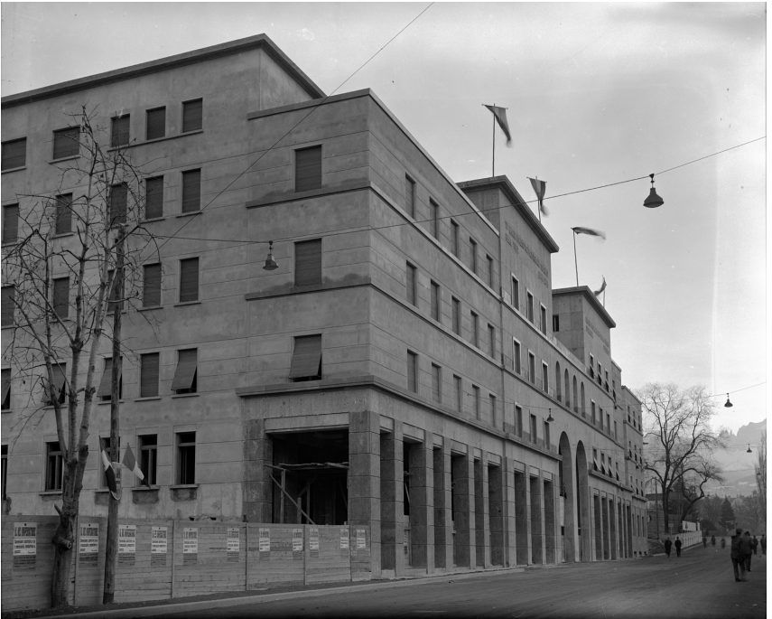
INA-Gebäude Bozen, heutige Freiheitsstraße, 1936 mit „Mussolini-Bogen“

Platz streitig zu machen. 95 1938 wurde das 1904 von Wilhelm Kürschner im Stil des bayerischen Barock entworfene Sparkassengebäude den Häusern der Città nuova angegliedert. 96 Besonders im Visier der faschistischen Urbanisten stand das Bozner Stadtmuseum. Der neugotische Turm des Gebäudes ragte nämlich aufgrund seiner Höhe weithin sichtbar aus dem Bild der Altstadt heraus. Außerdem sah Ettore Tolomei in diesem Museum eine Hochburg des Deutschtums und forderte dessen Italianisierung. Aber auch hier schlug das Regime erst auf dem Gipfel seiner Macht zu: 1936 begann man damit, das gesamte äußere Erscheinungsbild des Hauses im Stil der nahe gelegenen Città nuova umzugestalten. Kernelement war dabei die Entfernung des markanten neugotischen Dachturms mit seinen hervorstechenden „deutschen“ Zinnen, der durch ein tiefer liegendes „italienisches“ Flachdach ersetzt wurde. 97