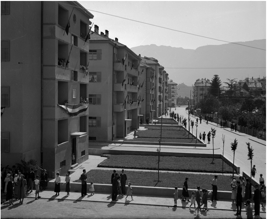
Einweihung von „Case Popolari V. Lotto“ Bozen Turinstraße (?) 1937