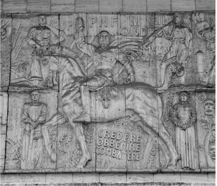
Mussolini reitet und grüßt noch immer vom ehemaligen Parteigebäude in Bozen, heute Finanzamt

individuell unterschiedlich gestaltete Säulen, Renaissancebalkone, Terrassen und byzantinische Ornamente schmücken die Fassaden. 81